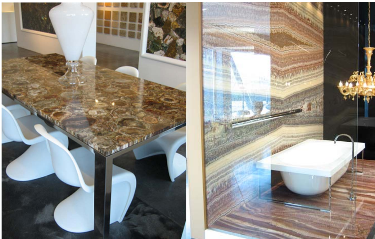
Bilder aus der Lifestyle-Ausstellung der Antolini & C. in Verona, Italien