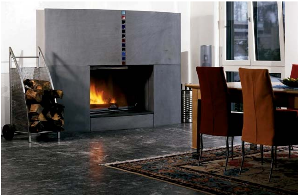
Von der Real-Stein AG eingerichtetes und so bestehendes Wohnzimmer