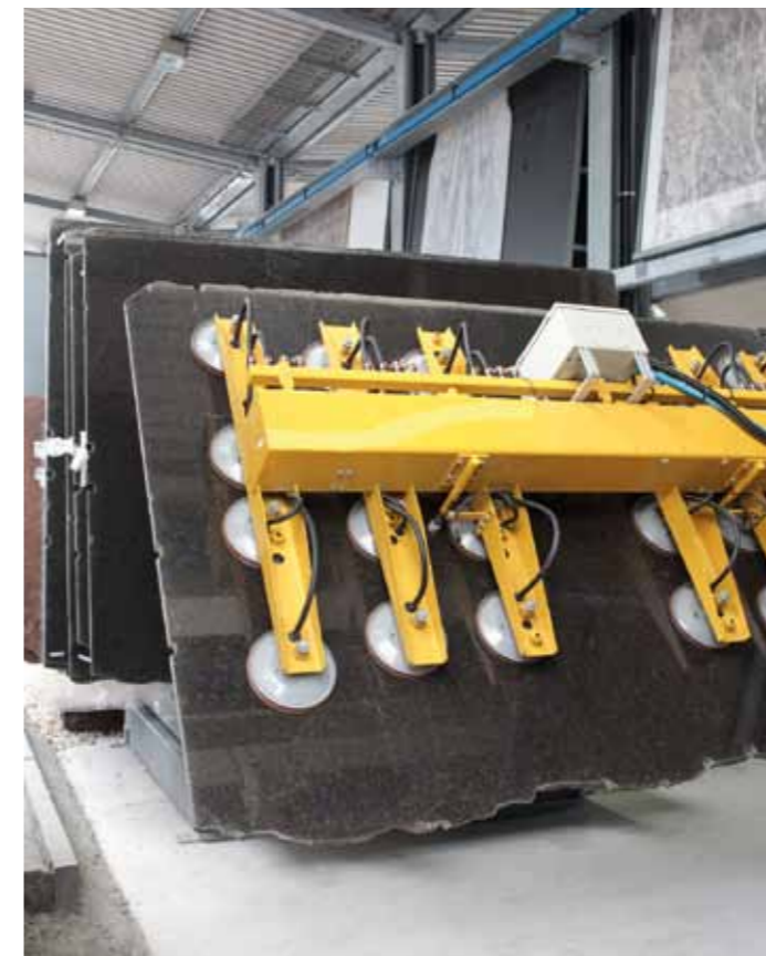
Durch Vakuumgeräte lassen sich die grossformatigen Steinplatten sicher heben und umplatieren.