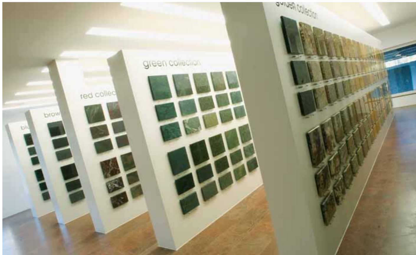
Eine der Ausstellungen im Hauptsitz der Real-Stein AG in Gibswil kategorisiert zahlreiche Steinmuster nach Farben und präsentiert innerhalb der Farbgruppen denselben Stein jeweils in drei unterschiedlichen Oberflächenverarbeitungen.